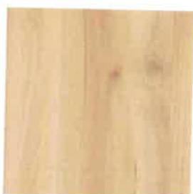
Dřevodekor buku přírodního v klasické jednoduchosti z CPL laminátu.