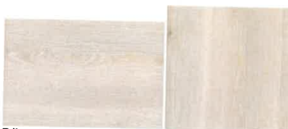
Dřevodekor borovice švédské v horizontálním nebo vertikálním směru s povrchovou strukturou ve 3D.

Nové dekory i kompletní montáž dveří je možné také prodiskutovat v nové vzorkové prodejně MASONITE v Praze (Českomoravská 183, objekt Sykora Home).