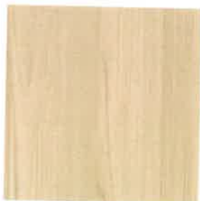
Dřevodekor z CPL laminátu Deluxe se strukturální povrchovou úpravou typu fleetwood šampaňský.