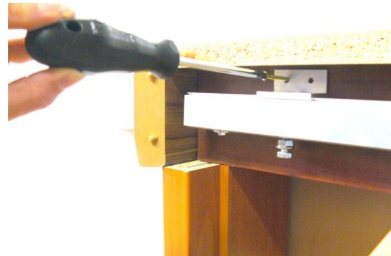
obr.4 Dokončená montáž garnýže